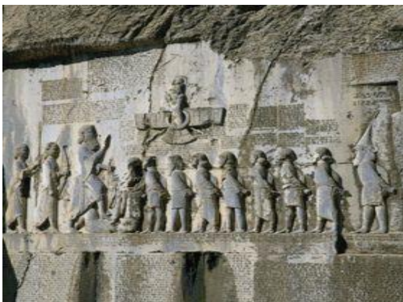
سنگ نبشته بیستون (14)

دولت ماد در کار ایجاد سازمانی گسترده و دقیق و متکی بر نهادهای قدرتمند در زمینه‌های سیاسی، اقتصادی، نظامی توفیق یافت. دیاکونوف با توجه به سنگ نبشته بیستون می‌گوید